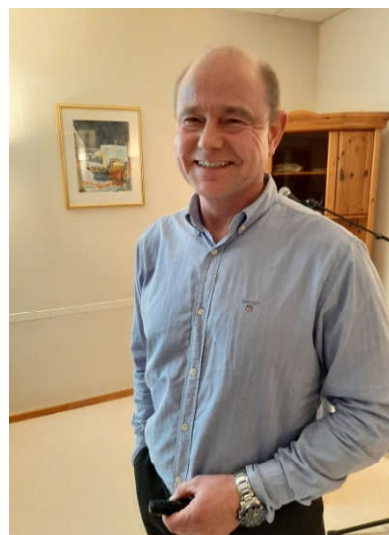
Arve gjorde greie for dei store linjene i det globale markedet og framtidsutsiktene.

De fleste kunder har hverken kapasitet eller kompetanse til å foreta plasseringer selv. Målet er å gi bedre avkastning enn de indeksene de måler seg opp mot. Framover forventes en årlig avkastning på 8 - 10 %. Egenkapitalbevis i Sparebanken Møre har gitt god avkastning.