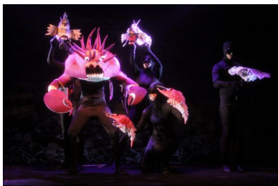
Krabbe Krølle i aksjon