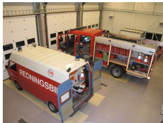
Brannbil og redningsbil står klar til utrykning

Forventningene til løsning av oppgavene er nok større enn ressursene, og kan ikke sammenlignes med for eksempel amerikanske TV-serier. Bilparken rundt om er for det meste for veteranbiler å regne. Hovedbrannbilen i Brattvåg er 10 år gammel, redningsbilen 22 år, bilen i Søvik er 25 år, og enda eldre er bilene