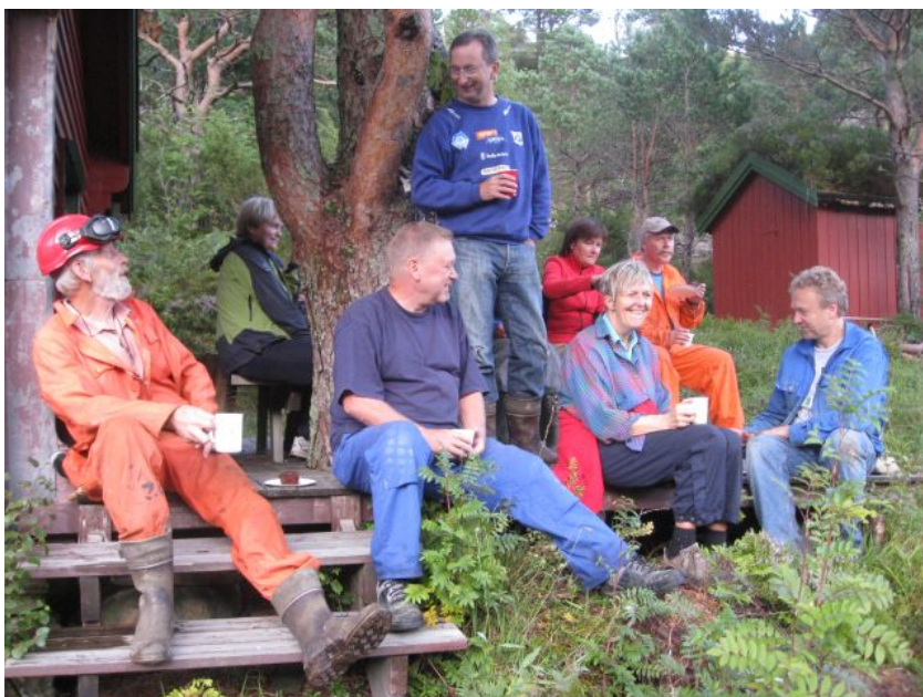
Kaffirast ved Karihytta