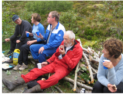
Kaffepause må til når det er dugnad.

Vegen på vestsiden av vannet er i ferd med å gro igjen, så klubben i