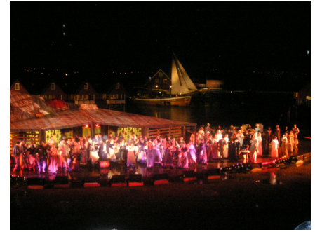
Fra oppsetningen "Donna Baccalao"