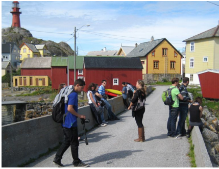
Frå brua mellom Husøya og Ona.