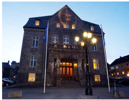
Festiviteten i Kristiansund