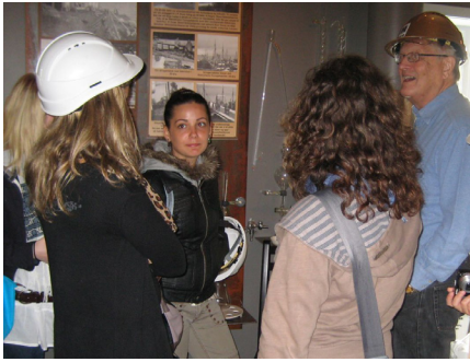
Inge fortel frå historia (museet).

Fredag vart det ny tur med ferja, men no til Dryna, der medlemmer frå Midsund RK stod klare til å overta stafettspinnen. SV