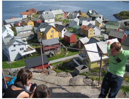
Utsikt frå Ona fyr.