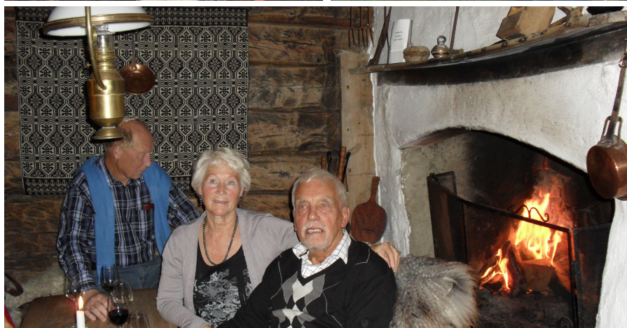
Bilder fra turen til Håholmen