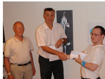
Brattvåg Rotary tar imot gave fra Butenesta i Haram