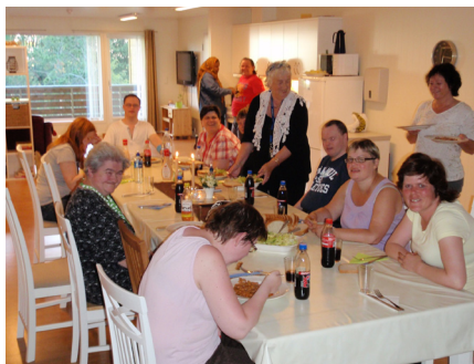
En glad givergjeng

Butjenesta i Haram og fikk overrakt overskuddet fra førjulstilstelinga i 2010. Pengene skal brukes til arbeidet med lysløypa rundt Synnalsvannet. Beboerne bruker løypa flittig og setter stor pris på at det blir lys der. HG