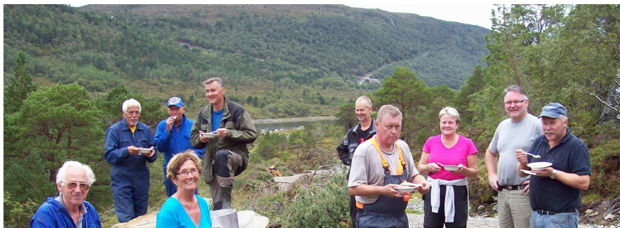
Nokre av ryddegjengen i ein velfortent pause