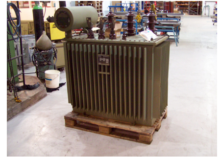
En av Møre Trafos transformatorer

er standard transformatorer som produseres for lager. Omsetningen har siden 2006 holdt seg ganske jevn uten påvirkning av finanskriser. Lite tap på fordringer og en fortjeneste siste år på vel 20 mill. Har de siste 4 år investert 30 mill. i utvikling og opprusting av egen bedrift slik at den nå er topp moderne. Vi merket oss lyse, rene og romslige produksjonslokaler. Bedriften er opptatt av miljø, og har en gjenvinningsgrad på 98% av produktene. Virkningsgrad på 99%. Ønsker kortreiste produkter, og har transportkostnader på ca 2% av omsetningen. Transformatorene har en levetid på 50 år. Nordiske E-verk tar 80% av produksjonen, resten går offshore, jernbane og til større byggeprosjekt. "Drømmer om å skape noe over tid" var tanken i starten. "Sikker strømforsyning under alle forhold" er bedriftens visjon. "Mer av det som teller". Ønsker å være rådgivere som ikke gjør noe mer komplisert