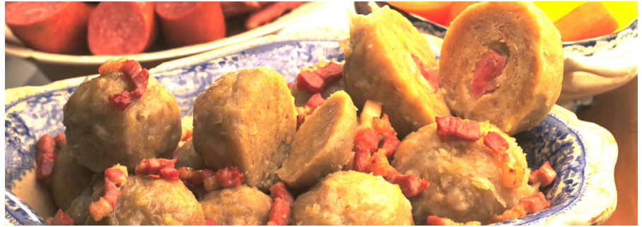
Potetball er Sunnmøres nasjonalrett