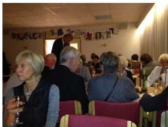
Stemningsbilde fra festen