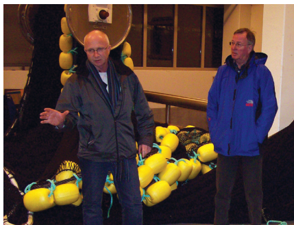
Besøk på Mørenot