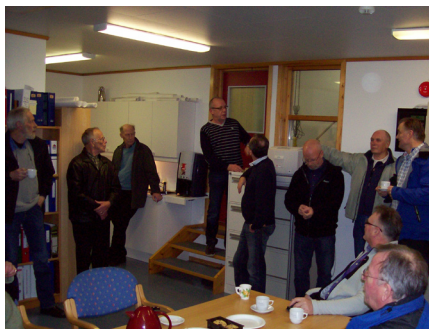
Lydhør forsamling på Vassverket

viser STX sin filosofi. STX/osv har sitt hovedkontor i Ålesund og har til sammen 9000 ansatte og en årsomsetning på ca 10 mrd., derav ca 6 mrd. I Norge. I Norge er det ca 1250 fast ansatte, men har en utstrakt bruk av utleiefirmaer. Er på børs i Singapore. Hovedvirksomheten er båtbygging og bygging av motorer, anleggsvirksomhet og energiproduksjon. Har virksomheter over hele verden. Det er 9 skipsverft med kjerneproduksjon ankerhåndtering, plattform, offshore og andre spesialskip. Leverer ca 20 skip pr år, og alle skrogene bygges i Romania. Ordreboka inneholder i dag 54 kontrakter som gjelder ut 2014. Det eksperimenteres med ny design og alternative framdriftsmetoder for å gjøre skipene mer miljøvennlige. Selskapet satser og i løpet av 3 år er det investert 120 mill kr. STX Brattvåg har 150 fast ansatte, 100 pers. i produksjon. På det meste jobbet 550 personer der. Er opptatt av HMS, og har klart å redusere sykefraværet. 65% av alt avfall går til gjenvinning. Et moderne verft som er godt tilpasset tidens produksjon med god kai- og krankapasitet og har en produksjonshall på 6000 m 2 . Samarbeider med HVS/TAF, partnerskapsklasser og andre med tanke på rekruttering. Skal i 2012 levere 4 båter, og har foreløpig kontrakt på 1 båt i 2013. HG