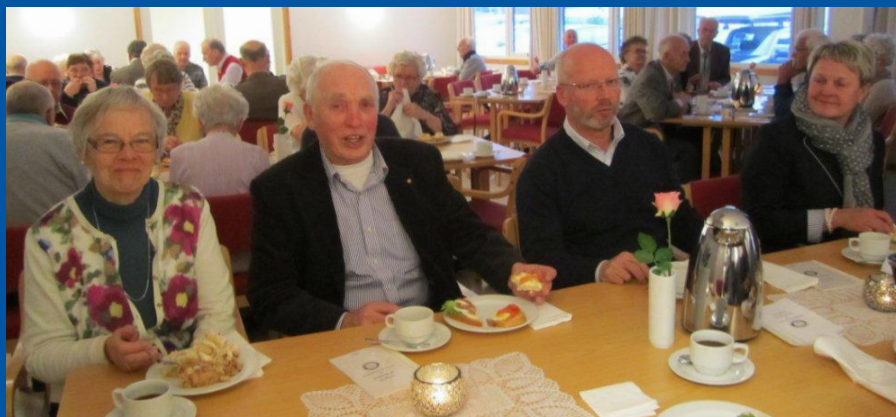
Bilder frå pensjonistfesten