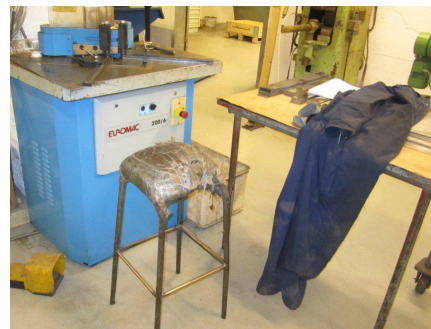
Arbeidsplass på Pyro

ske lærarar i historie, norsk og delvis matte. Får gode engelsk-kunnskaper og må innordne seg streng disiplin, kanskje litt for strengt. Eit anna nytt tilbud er kulde- og varmepumpe-teknikk, etterspurt av næringslivet. Foreløpig vanskeleg å få elevar og lære-plasser, men HVS er einaste mellom Bergen og Tr.heim med ei slik linje og fylket veldig ivrig på å lykkes med linja. Frå i år har HVS fått til ei halv klasse (6-7 stk) Eit mangfald av yrkes-muligheter etter å ha tatt ei slik studieretning. Stor interesse og mange spm frå salen :