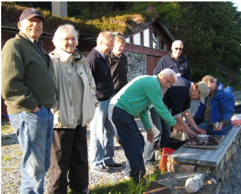
Fisken vert klargjort for gryta – to arbeider og seks kontrollerer