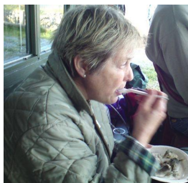
... og fisken smakte