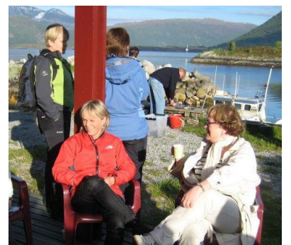
Idyllar i kveldssol