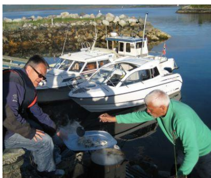
Fisken er kokt og klar for servering