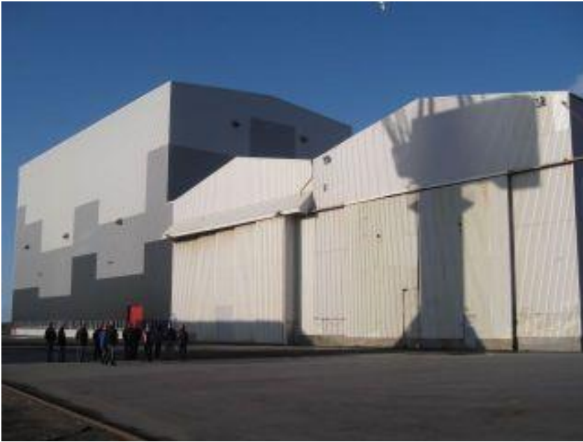
Store dimensjoner på Midsund Bruk – glødehallen bak til venstre

seres tankene etter sveising, og formålet er å ta ut spenningen i de delene av tanken som er sveiset.