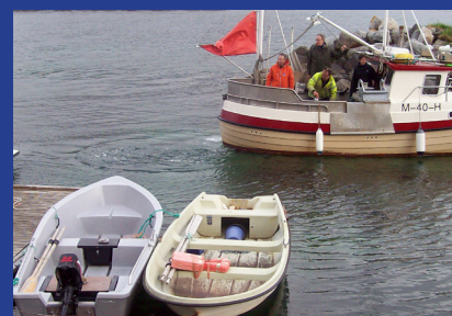
Fra havna på Drynaholmen