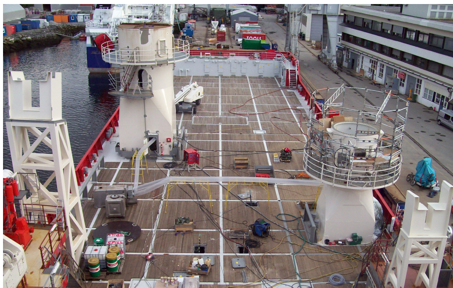
Utsikt fra broa på Gaya I