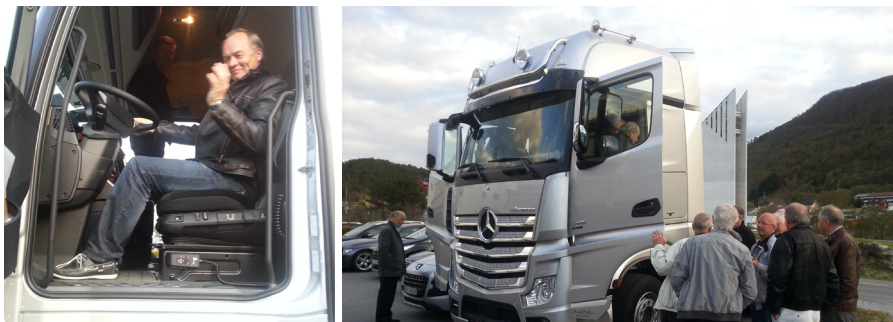
Visning og prøvesitting av lastebil