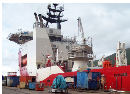
Gaya I sett fra kaia