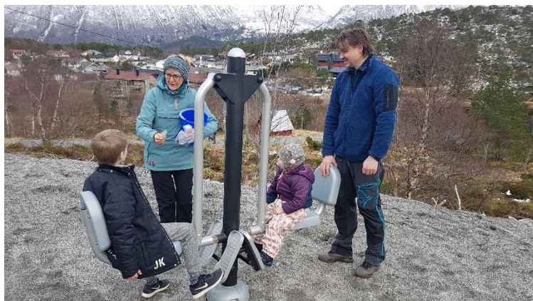
Testing av apparat.