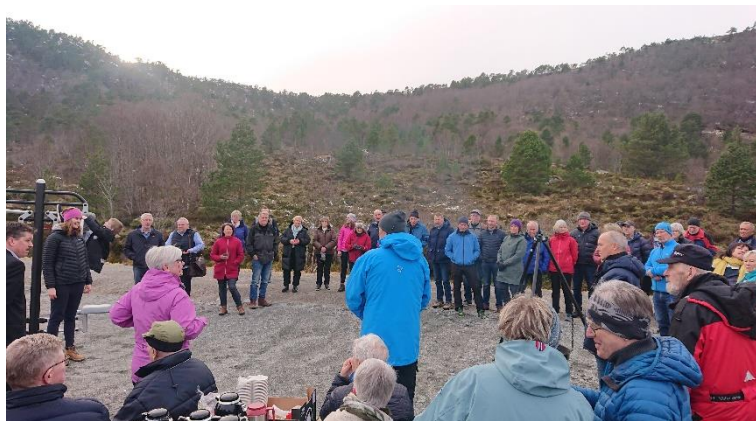
Orientering ved leder av Rotary sin prosjektgruppe.